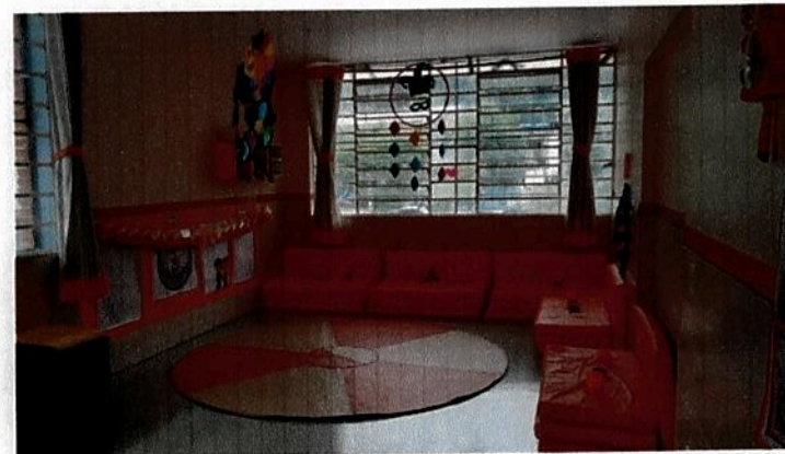
Sala de atividades MGII