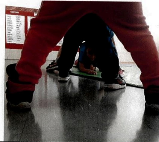
Turma de MGI Explorando a brincadeira "dança da serpente" Explorando o corpo, gestos e movimentos.