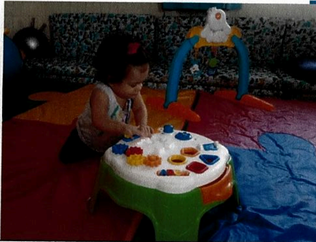
Atividade no berçário I, com brinquedos que estimulam a coordenação motora e o raciocínio lógico.

Meta 12 e Meta 13: De acordo as DCNEI no art. N° 09 os eixos estruturantes das práticas pedagógicas na educação infantil são as interações e brincadeiras, portanto todas as atividades teve uma intencionalidade educativa numa proposição de campos de experiências que são: O eu, o outro e o nós/ Corpo, gestos e movimentos/ Traços, sons, cores e formas/ Escuta, fala, pensamento e imaginação/ Espaços, tempos, quantidades, relações e transformações. Desde o berçário desenvolvemos com as crianças atividades significativas e com intencionalidade.