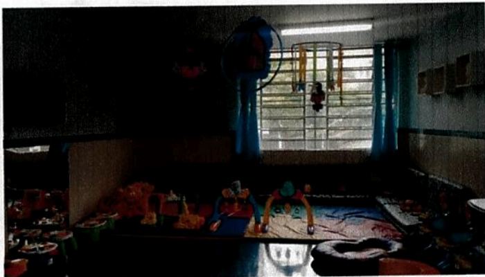
Sala de atividades BI

Meta 10: Considerando que o cotidiano da Educação Infantil é marcado por interações e experiências que acontecem em diferentes ambientes e momentos tivemos as brincadeiras e as interações como eixos de nosso currículo. A organização do tempo e do espaço físico contribuíram para a construção de diferentes linguagens e conhecimento de mundo através de atividades intencionalmente propostas; os brinquedos se mantiveram ao alcance e a disposição das crianças, organizados em caixas temáticas ou livres na brinquedoteca, além de materiais pedagógicos com jogos, livros, tintas e papelaria.