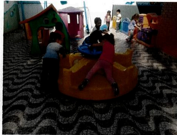
Hora de brincar no parque

Meta 4: Foi garantido 100% a organização dos espaços e tempos para pleno funcionamento, considerando a Orientação Normativa nº01/2015 p.16, o uso de cada espaço foi devidamente planejado e organizado de modo a proporcionar vivências significativas as crianças.