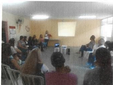
Reunião de IQ.