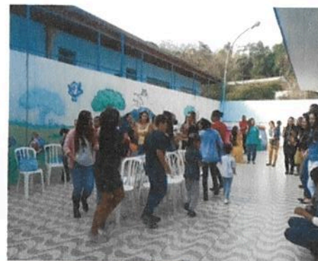
Festa da Família com exposição de atividades e oficinas de brincadeiras